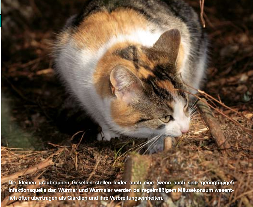
Die kleinen graubraunen Gesellen stellen leider auch eine (wenn auch sehr geringfügige!) Infektionsquelle dar. Würmer und Wurmeier werden bei regelmäßigem Mäusekonsum wesentlich öfter übertragen als Giardien und ihre Verbreitungseinheiten.

Giardien (genauer: Giardia intestinalis spec. oder synonym Giardia duodenalis spec. ) sind ubiquitär, will heißen, sie kommen eigentlich überall zurecht. Egal auf welchem Kontinent, egal in welcher Tierspezies: Giardien finden ihr Auskommen. Zahlreiche Unterarten sind